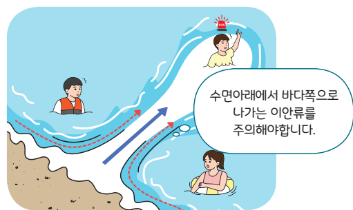
< 이안류(거꾸로 치는 파도) >