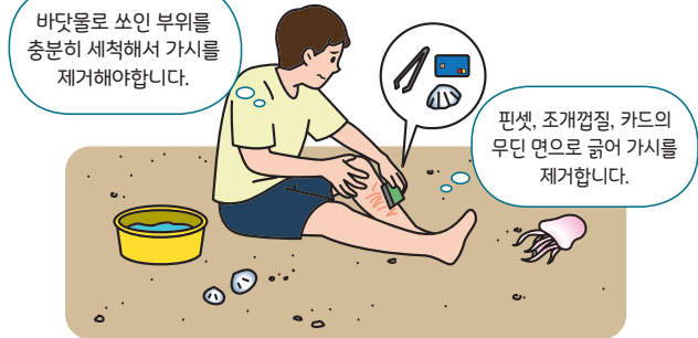
< 해파리에 쏘인 경우 대처요령 >