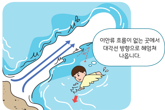
< 이안류 탈출 요령 >